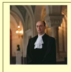
JUDr. Peter Tomka – předseda MSD

Mezinárodní soudní dvůr je hlavní soudní orgán OSN se sídlem v Haagu. Dr. Tomka úspěšně obhajoval Slovenskou republiku ve sporu o vodní dílo Gabčíkovo–Nagymaros. Působil jako velvyslanec při Stálé misi Slovenské republiky při OSN v New Yorku.